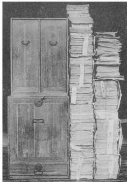
▲これは、子規が研究・分類した俳句原稿の写真です。2段重ねにした本箱よりも高く積み上げています。すごい量ですね。