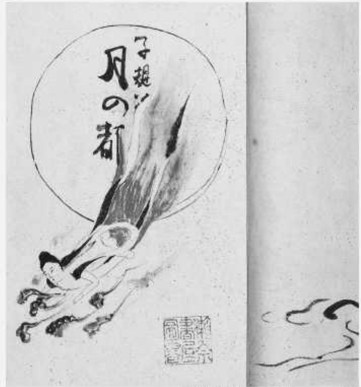
▲小説「月の都」(天理大学附属天理図書館蔵)