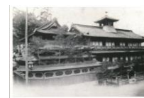
絵はがき 道後温泉 (明治時代) 明治27年4月本館竣工。子規と漱石が入浴したのは完成間もない頃。 82円(税込価格) 76円+税