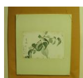
色紙 <青梅> (当館オリジナル 子規画)