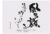
子規の俳句ポストカード (当館オリジナル・石丸繁子書) 風呂敷をほどけば柿のころげけり 82円(税込価格) 76円+税