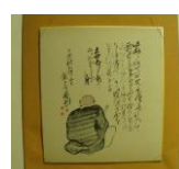
色紙<蕪村面贊> (当館オリジナル 蕪村筆)