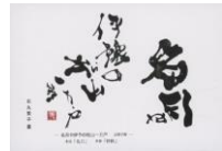
子規の俳句ポストカード (当館オリジナル・石丸繁子書) 名月や伊予の松山一万戸 82円(税込価格) 76円+税