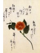
絵はがき 朝顔 (当館オリジナル)子規画 82円(税込価格) 76円+税