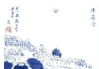
デザインはがき 子規居士十五周年忌記念画帖 (当館オリジナル) 82円(税込価格) 76円+税