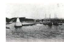
絵はがき 伊予三津港 (明治時代) 城下町松山の外港として、昔から繁栄した伊予三津港。 82円(税込価格) 76円+税