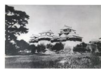
絵はがき 松山城 (明治時代) 加藤嘉明が1602年に築城した名城。 82円(税込価格) 76円+税