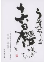
子規の俳句ポストカード (当館オリジナル・石丸繁子書) うそのやうな十六日櫻咲きにけり 82円(税込価格) 76円+税