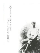
デザインはがき 子規・ユニフォーム姿 (当館オリジナル) 82円(税込価格) 76円+税