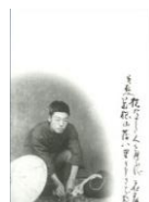
デザインはがき 子規・旅立ちの姿 (当館オリジナル) 82円(税込価格) 76円+税