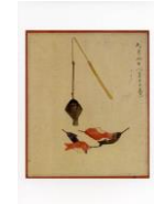
絵はがき 魚釣り玩具 (当館オリジナル)子規画 82円(税込価格) 76円+税