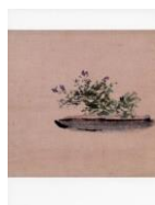
絵はがき 水盤と草花 (当館オリジナル)子規画 82円(税込価格) 76円+税