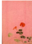
絵はがき 草花図(ノウゼンハレン) (当館オリジナル)子規画 82円(税込価格) 76円+税