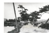
絵はがき 三津街道 (明治時代) 参勤交代の藩主や船に乗る人々が通行した三津街道。 82円(税込価格) 76円+税