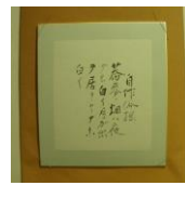
色紙 <蕎麦の畑> (自作俗謡 蕎麦ノ畑ハ夜デモ 白イ月ガ出テ居リヤナホ白イ) (当館オリジナル 子規筆)