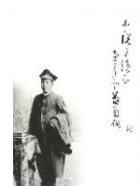
デザインはがき 子規・大学予備門 (当館オリジナル) 82円(税込価格) 76円+税