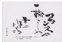
子規の俳句ポストカード (当館オリジナル・石丸繁子書) フランスの一輪ざしや冬の薔薇 82円(税込価格) 76円+税