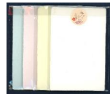
リサイクルはがき (無地・5枚組)

牛乳パックから作られたはがき ①白色 5枚組 ②水色 5枚組 ③ピンク色 5枚組 ④黄色 5枚組