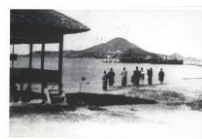
絵はがき 三津浜の海岸 (明治時代) 子規が上京する際に乗船し、漱石が来松の際に上陸した三津浜の海岸。 82円(税込価格) 76円+税