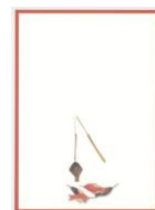
デザインはがき 魚釣り玩具 (当館オリジナル)子規画 82円(税込価格) 76円+税