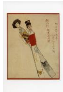
絵はがき 紙人形 (当館オリジナル)子規画 82円(税込価格) 76円+税