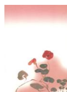
デザインはがき 草花図(ノウゼンハレン) (当館オリジナル)子規画 82円(税込価格) 76円+税