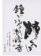
子規の俳句ポストカード (当館オリジナル・石丸繁子書) 柿食へば鐘が鳴るなり法隆寺 82円(税込価格) 76円+税