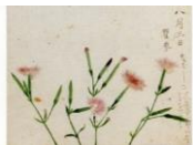
絵はがき なでしこ (当館オリジナル)子規画 82円(税込価格) 76円+税