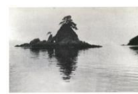
絵はがき 四十島 (明治時代) 小説『坊っちゃん』の中の「ターナー島」のモデル。 82円(税込価格) 76円+税