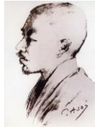
絵はがき 子規肖像画 (当館オリジナル)浅井忠筆 82円(税込価格) 76円+税