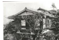
絵はがき「愚陀仏庵」2階 (明治時代) 82円(税込価格) 76円+税