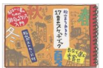
ポストカードブック 松山まちあるき 17音のスケッチブック 324円(税込価格) 300円+税