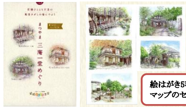
絵はがき5種類と マップのセット