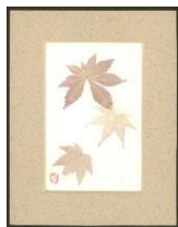
リサイクル絵はがき (紅葉柄・2枚組)

紅葉ではがきに色を付けていますので、柄はそれぞれで違います。(はがき立ては別売り)