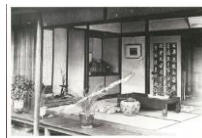
絵はがき「愚陀仏庵」1階内部 (明治時代) 82円(税込価格) 76円+税