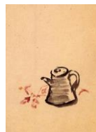
絵はがき 水差しと秋海棠 (当館オリジナル)子規画 82円(税込価格) 76円+税