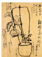
絵はがき 鉢植南瓜 (当館オリジナル)子規画 82円(税込価格) 76円+税