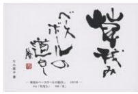
子規の俳句ポストカード (当館オリジナル・石丸繁子書) 草茂みベースボールの道白し 82円(税込価格) 76円+税