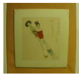
色紙 <紙人形> (当館オリジナル 子規画)