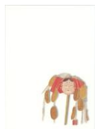
デザインはがき 西ノ市ノ於多福 (当館オリジナル)子規画 82円(税込価格) 76円+税