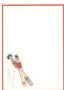
デザインはがき 紙人形 (当館オリジナル)子規画 82円(税込価格) 76円+税