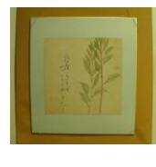
色紙 <鶏頭面贊> (鶏頭はまだ下草よ女郎花) (当館オリジナル 子規画)