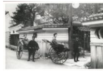
絵はがき 人力車 (明治時代) 明治5年、松山に登場した人力車は数少ない交通の手段であった。 82円(税込価格) 76円+税