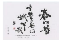
子規の俳句ポストカード (当館オリジナル・石丸繁子書) 春や昔十五万石の城下哉 82円(税込価格) 76円+税