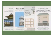
ポストカードセット韓国語 (4枚入り)

道後の二つの観光施設の案内と、正岡子規の有名な二つの句を解説したイラスト絵はがきのセット。上に日本語、下に韓国語が書かれています。