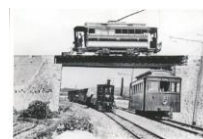
絵はがき 六軒家付近 (明治時代) 伊予鉄道と松山電気軌道が立体交差する六軒家付近。 82円(税込価格) 76円+税