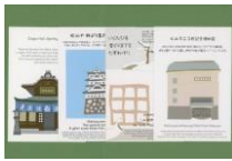
ポストカードセット英語 (4枚入り)

道後の二つの観光施設の案内と、正岡子規の有名な二つの句を解説したイラスト絵はがきのセット。上に日本語、下に英語が書かれています。