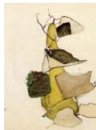
絵はがき 糸瓜 (当館オリジナル)子規画 82円(税込価格) 76円+税