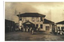
絵はがき 道後鉄道の道後駅 (明治時代) 道後、一番町、三津口の間を走っていた道後鉄道の道後駅。 82円(税込価格) 76円+税