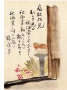
絵はがき 病床所見 (当館オリジナル)子規画 82円(税込価格) 76円+税