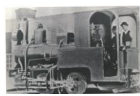
絵はがき 軽便鉄道 (明治時代) 明治21年に松山と三津を結んで開通した日本最初の軽便鉄道。 82円(税込価格) 76円+税