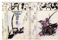
絵はがき 画道独稽古 野菊図・葛と猿公園 (当館オリジナル)子規画 82円(税込価格) 76円+税