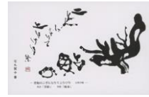
子規の俳句ポストカード (当館オリジナル・石丸繁子書) 若鮎の二手になりて上りけり 82円(税込価格) 76円+税