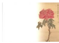
デザインはがき 牡丹図 (当館オリジナル)子規画 82円(税込価格) 76円+税