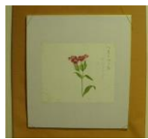
色紙 <カラナデシコ> (当館オリジナル 子規画)