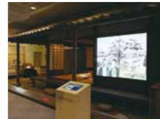
영상 코너 「영상으로 만나는 구다부쓰안」