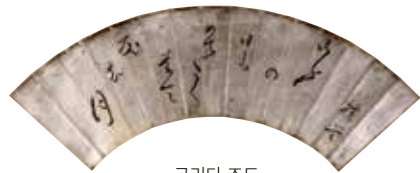
구리타 조도 「오늘 태양도 경사스럽게 지고 여름달 뜨네」