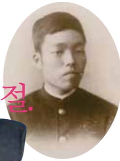
학창 시절의 시기 시기의 학생모