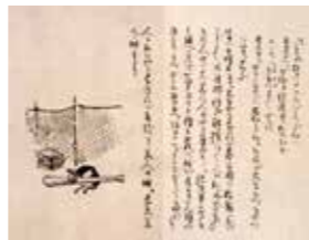
시기의 소설 원고 「아마부키노 히도에다(일본최초의 야구소설)」