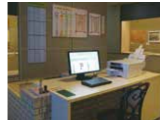
「하이쿠를 지어 보자」 ※자작 하이쿠를 단자쿠종이에 인쇄가능합니다.