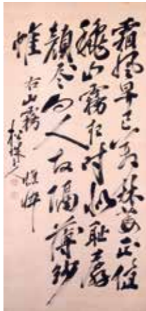
마쓰다이라 사다미치의 한시