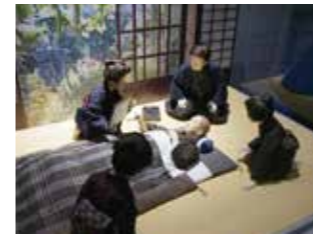
인형 시기의 「절필삼구」