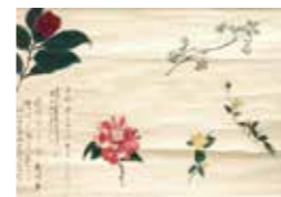
시기가 그린 그림 초화도