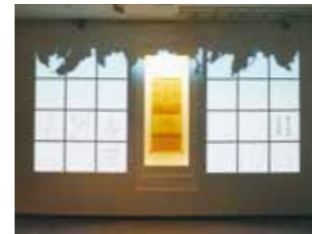
시기의 하이쿠 「절필삼구」 ※글자에 손을 대면 하이쿠가 적힌 순서대로 떠오릅니다.