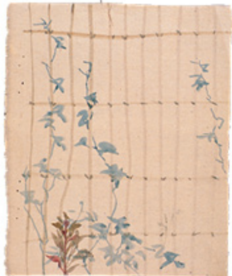
子规画《蔓草和鸡冠花》